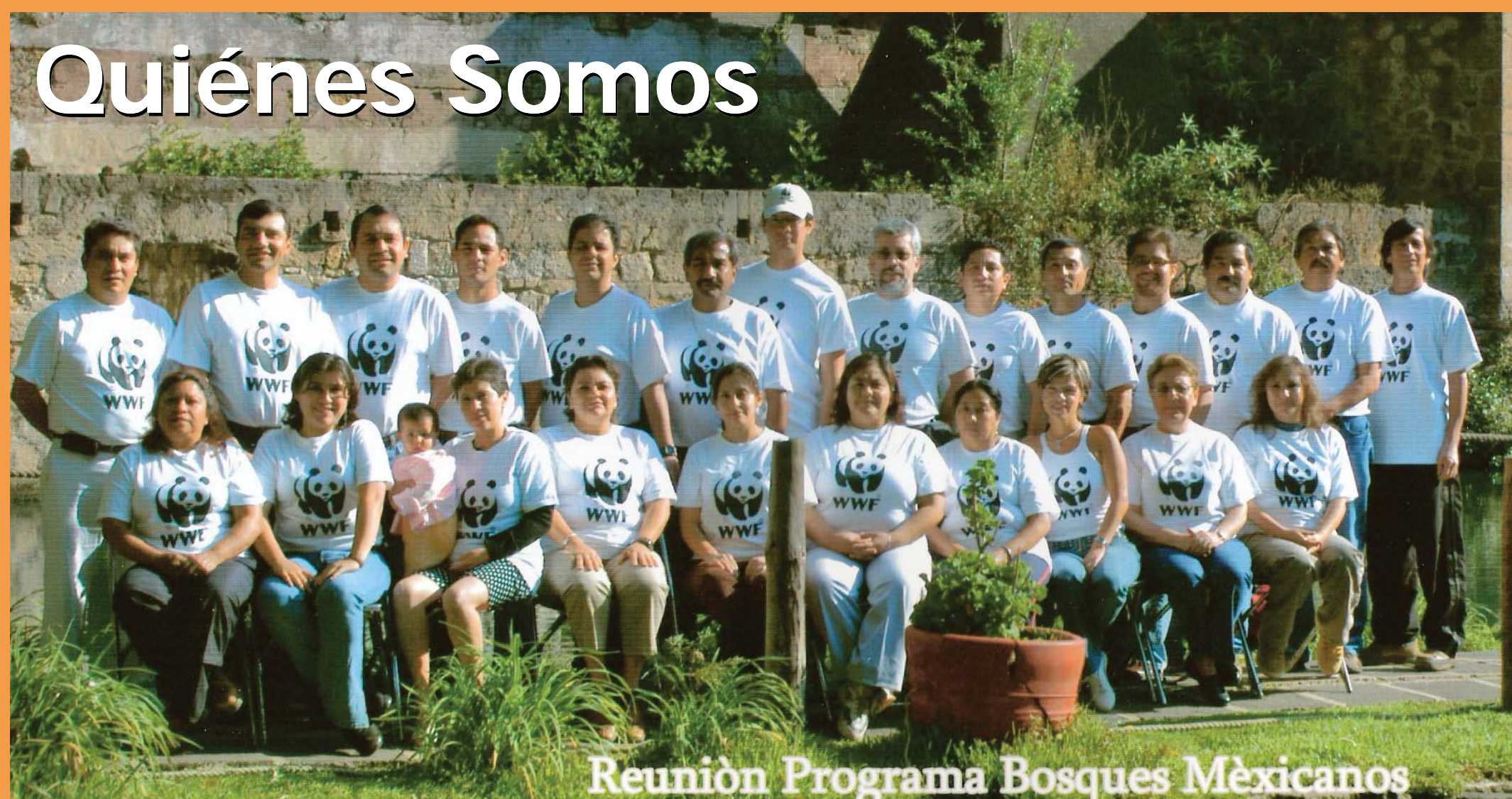
Reunión Programa Bosques Mexicanos