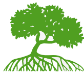
Manglares / Mangroves