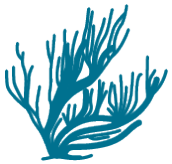
Corales / Corals