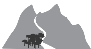
Senderos / Hiking