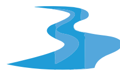
Río / River