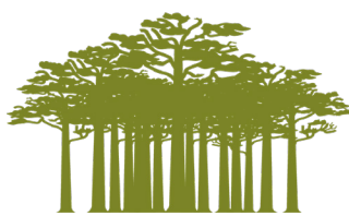
Bosque / Forest