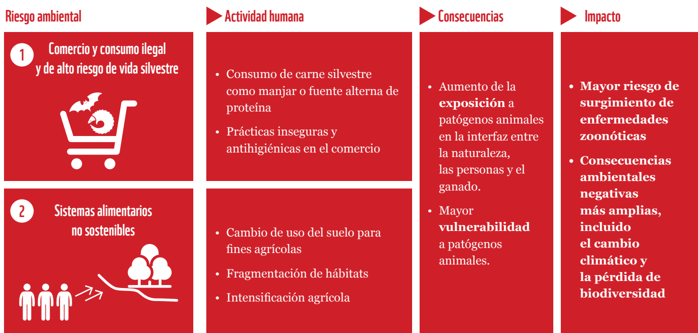
FIGURA 3: PROMOTORES CLAVE DE NUEVAS ENFERMEDADES ZONÓTICAS