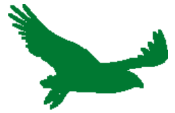
Avistamiento de aves / Bird watching