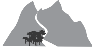
Senderos / Hiking