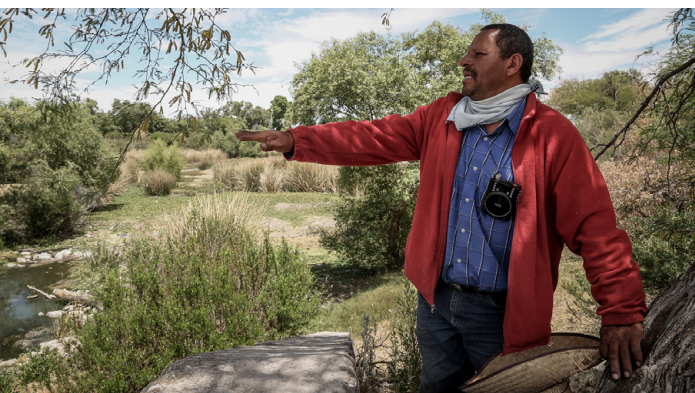
© Seila Montes / Pastor que lleva a sus vacas a comer y beber habla de los problemas del río Tunal, Durango.

En este contexto, el periodismo ambiental desempeña un papel clave en la respuesta social frente a las crisis ecológicas. Al informar con profundidad sobre los impactos, las causas, las consecuencias y las posibles soluciones de los problemas ambientales, las y los periodistas pueden generar conciencia, movilizar a la ciudadanía e influir en la agenda pública, ejerciendo presión sobre los tomadores de decisiones para que actúen con responsabilidad y urgencia.