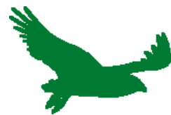
Avistamiento de aves / Bird watching