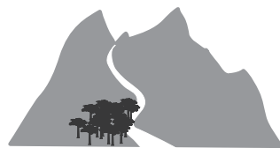
Senderos / Hiking